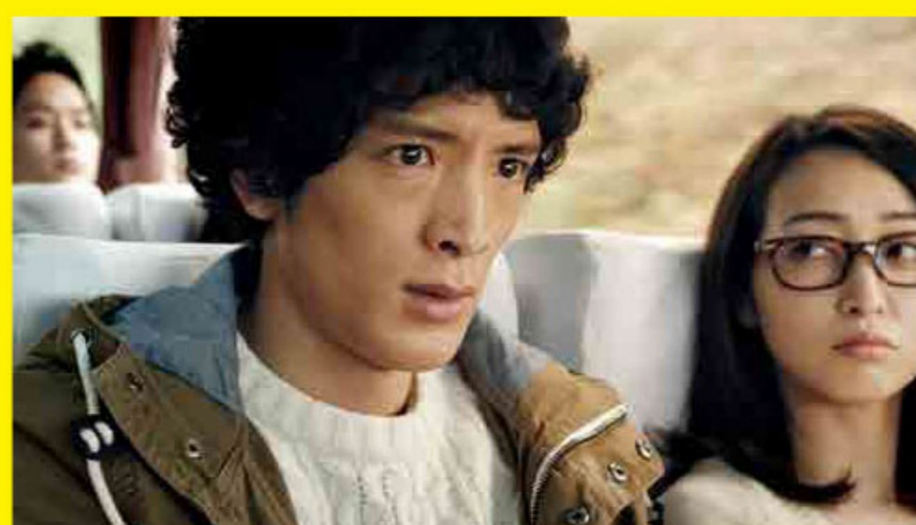
第1回いばらきショートフィルム大賞『ストロポ』

映像から生まれる茨城の魅力(風景、文化、食等)を国内外に発信し、観光誘客の促進を図るスクリーンツーリズムを推進します。このため、茨城の魅力にあふれたショートフィルム作品を現在募集中!なお、ノミネート作品及び受賞作品は、米国アカデミー賞公認映画祭である「ショートショート フィルムフェスティバル & アジア2018」で上映します!!