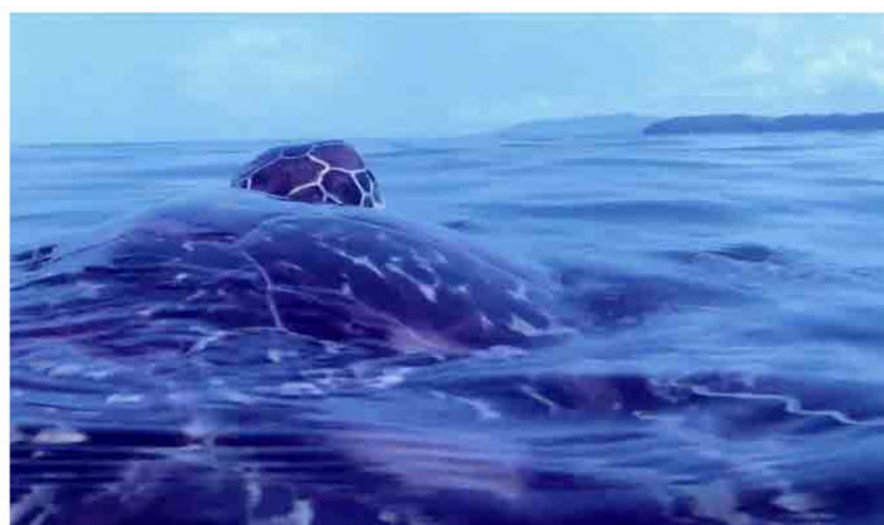
第3回いばらきショートフィルム大賞『海ガメの約束』