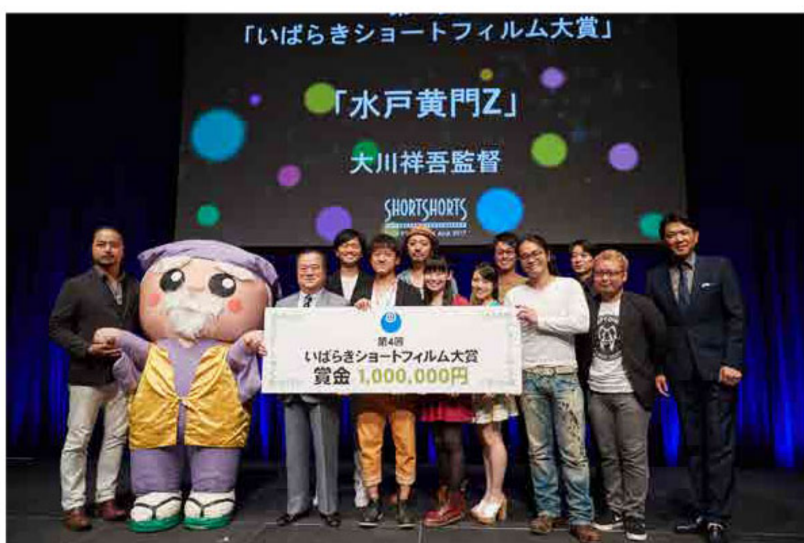
SSFF & ASIA 2017「第4回いばらきショートフィルム大賞」発表の様子