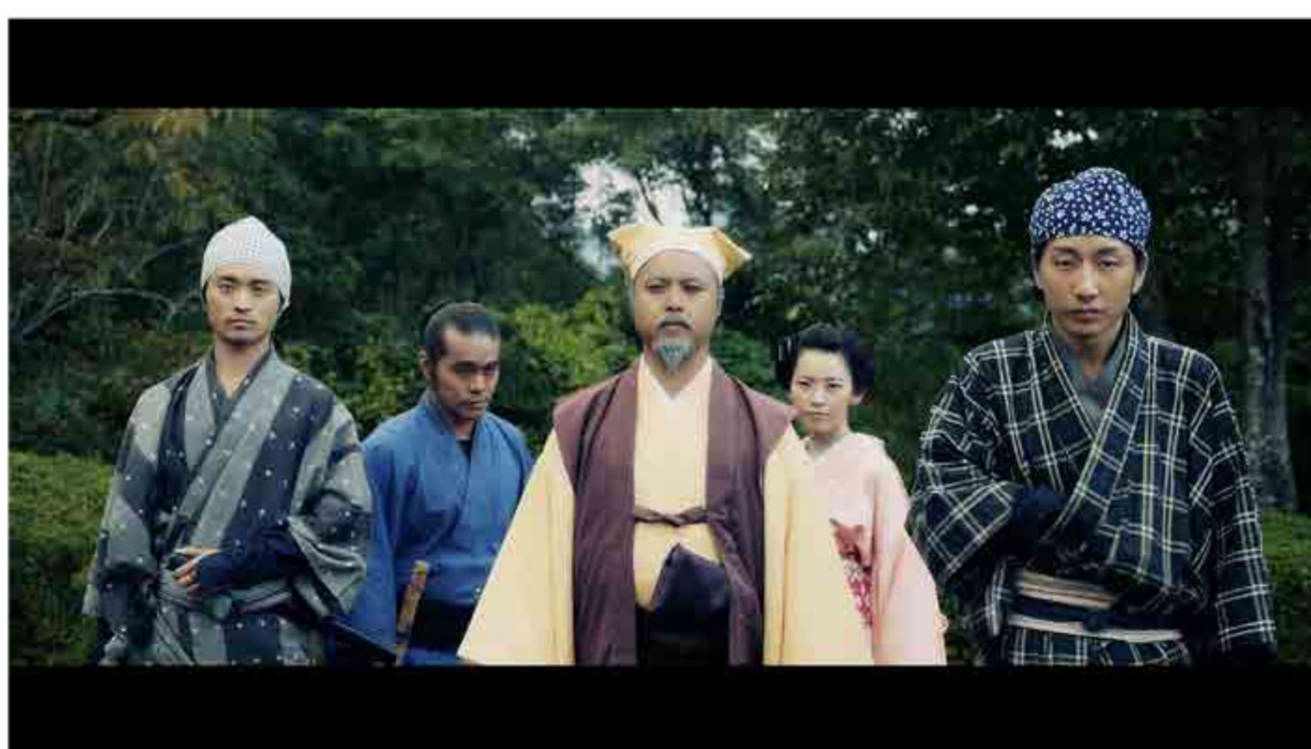
第4回いばらきショートフィルム大賞『水戸黄門Z』