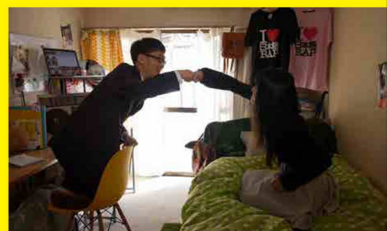
第2回いばらきショートフィルム大賞『帰ろうYO』